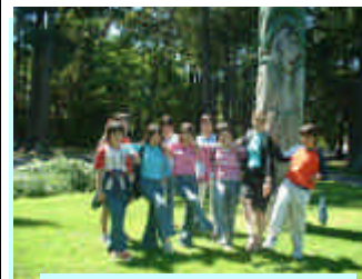
楽しいアクティビティ!

成田空港から引率者同行 地元カナダ人学生と国際交流できます 滞在先からはファミリーが送迎致します