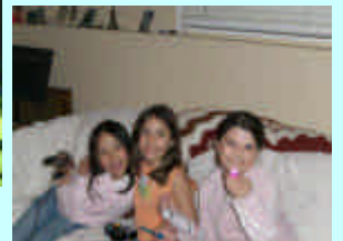
ホストシスターと